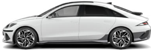
Serenity White Pearl