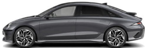
Nocturne Gray Metallic