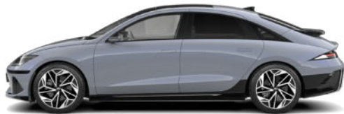
Transmission Blue Pearl