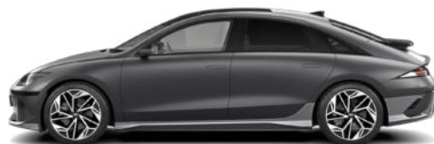
Nocturne Gray Matte

Pflegehinweis bei Fahrzeugen mit Mattlackierung: Autowaschanlagen mit drehenden Bürsten dürfen nicht verwendet werden, da sie die Oberfläche Ihres Fahrzeugs beschädigen können. Dampfreiniger, die die Fahrzeugoberfläche mit hohen Temperaturen reinigen, können dazu führen, dass Öl auf dem Lack haftet und schwer zu entfernende Flecken bildet. Verwenden Sie bei der Autowäsche ein weiches Tuch (z. B. Mikrofasertuch oder Schwamm) und trocknen Sie das Auto mit einem Mikrofasertuch. Wenn Sie Ihr Auto von Hand waschen, sollten Sie keinen Reiniger verwenden, der mit einer Wachsbehandlung abschließt. Wenn die Fahrzeugoberfläche stark verschmutzt ist (Sand, Schmutz, Staub, Verunreinigungen usw.), spülen Sie die Oberfläche zunächst mit Wasser, bevor Sie das Fahrzeug waschen. Verwenden Sie keinen Lackschutz (wie Schaumwaschmittel), Scheuermittel oder Politur. Wurde Wachs aufgetragen, entfernen Sie das Wachs umgehend mit einem Silikonreiniger. Wenn Teer oder Teerverunreinigungen vorliegen, verwenden Sie zu deren Entfernung einen geeigneten Teerentferner. Achten Sie jedoch darauf, nicht zu viel Druck auf die Lackierung auszuüben.