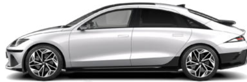
Curated Silver Metallic