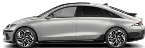
Gravity Gold Matte