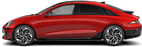
Ultimate Red Metallic