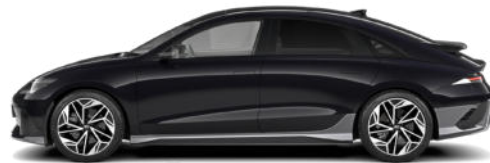
Abyss Black Pearl