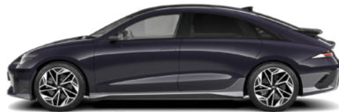
Biophilic Blue Pearl